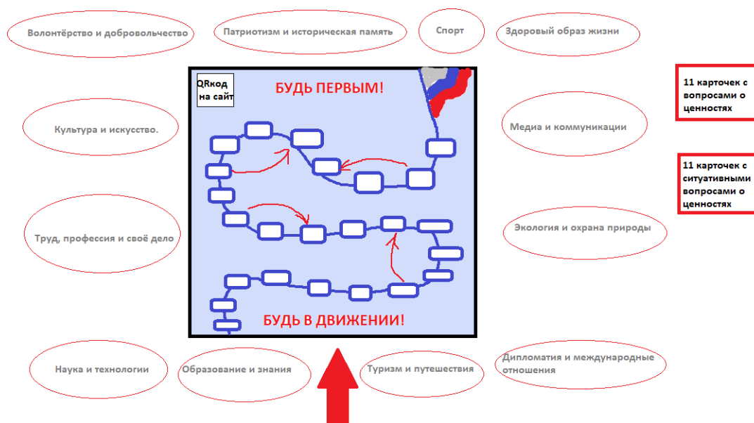
Рис. 1. Игровое поле Игры

строительного скотча либо цветного мела (рис. 1). По игровому полю могут передвигаться участники, либо они передвигают свои отрядные фишки.